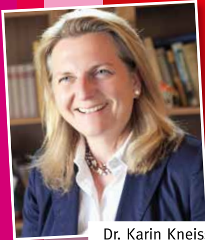
Dr. Karin Kneissl Nahostexpertin